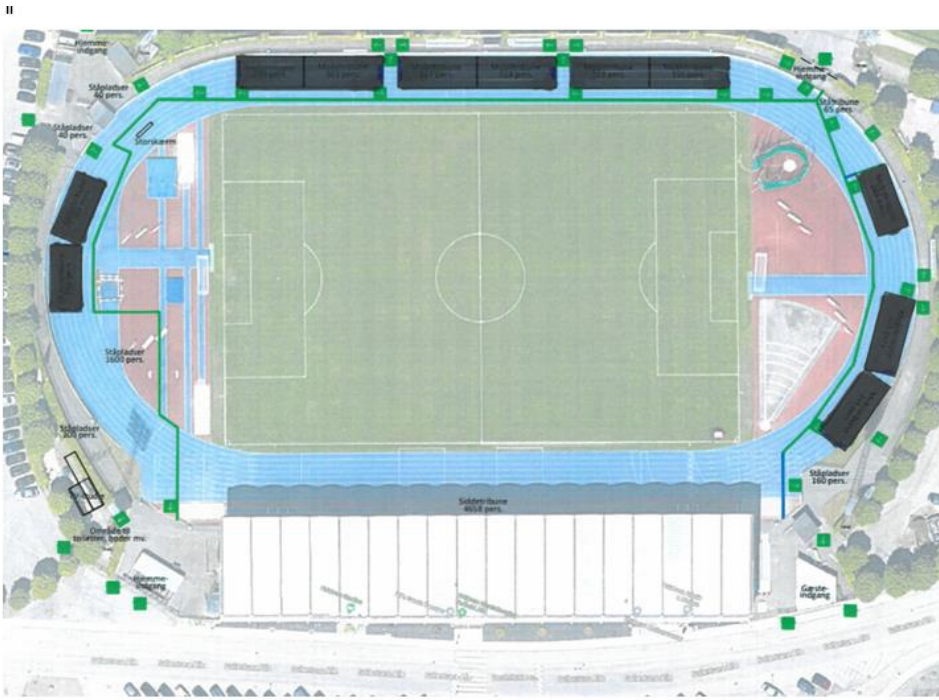
Figur 1: Situationsplan af Hvidovre Stadion med tribuner. Blå pil indikerer nord.