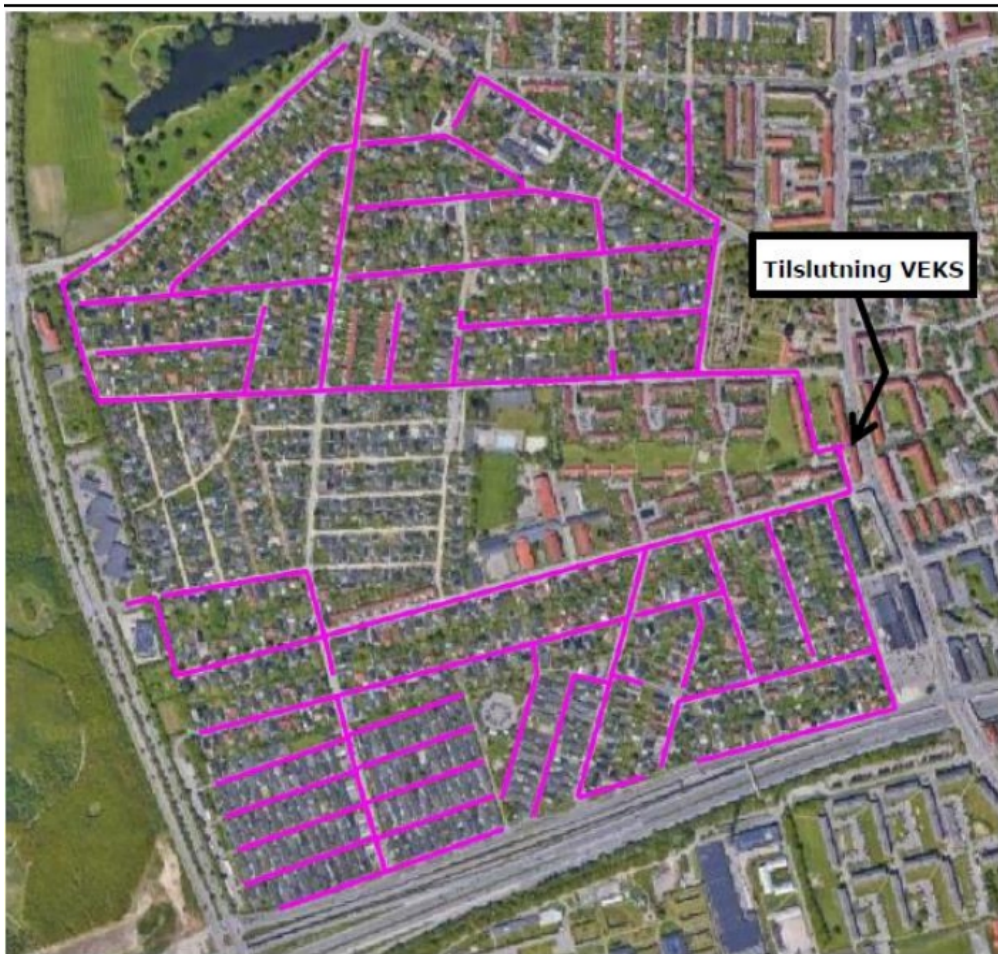
Figur 1 Af kortet fremgår projektplaceringen, ledningsnettet og tilslutningspunktet

Projektplaceringen, ledningsnettet og tilslutningspunktet fremgår af nedenstående kort.