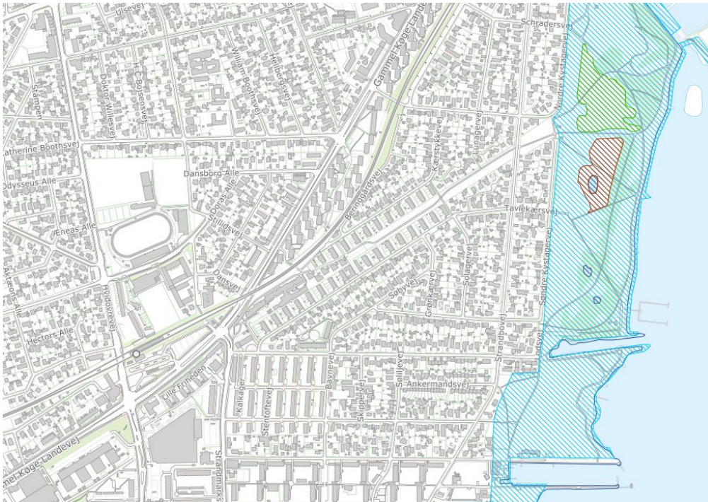
Figur 2: Placering af fredede naturområder.

De nærmeste fredede naturområder er Kystagerparken som ligger ca. 1,3 km mod øst. Området er omfattet af Kalvebokilefredningen. Inden for fredningen er beliggende en række §3 områder bl.a. mose, eng og søer, se figur 2.