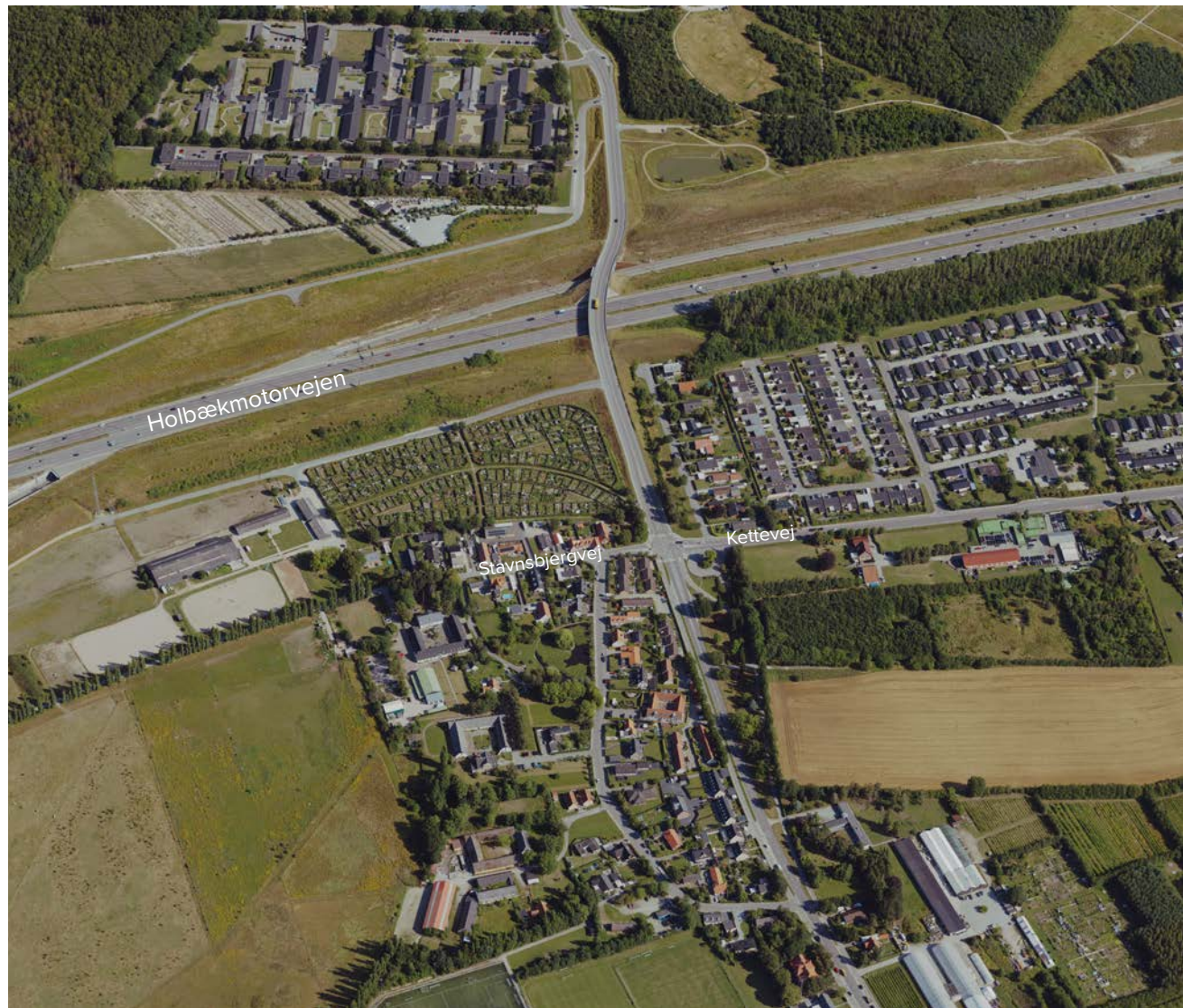
Luftfoto af ridecenter og nyttehaver nord for Avedøre Landsby.

For at kunne vedtage Lokalplan 475 for energianlæg ved rideskolen på Avedøre Slettevej vil det være nødvendigt, gennem et tillæg til Kommuneplan 2021, at ændre rammebestemmelsen for kommuneplanens område 4F8.