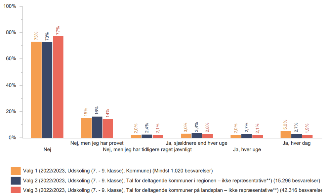
Figur 1: Valg 1 = Hvidovre Kommune, Valg 2 = Tal for deltagende kommuner i Region Hovedstaden, Valg 3 = Tal for deltagende kommuner på landsplan. **Tal på hhv. regionsniveau og landsplan er en sum af de deltagende kommuner. Tallene giver alene et fingerpeg om tendenser.